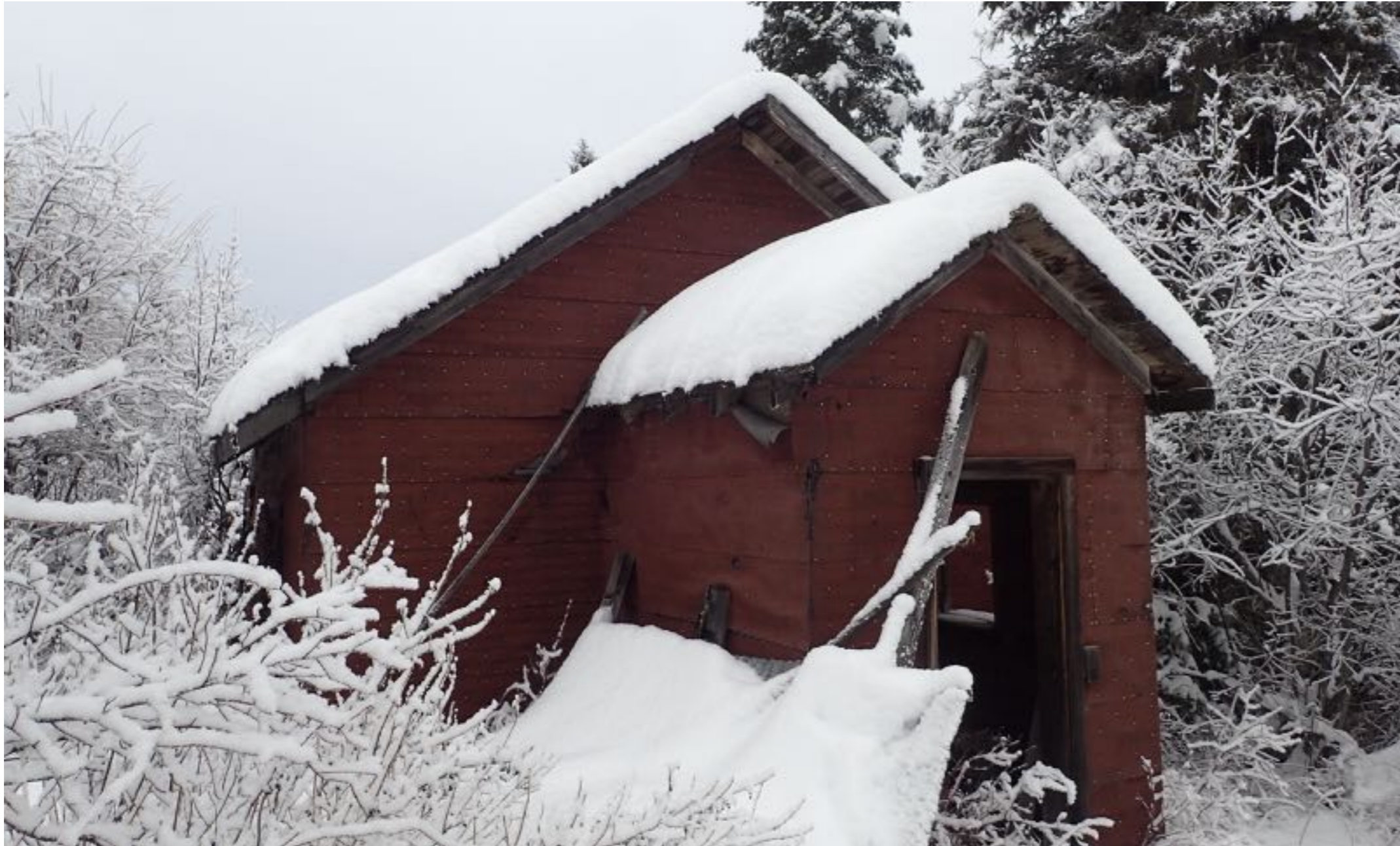
Le chalet le plus récent sur ma ferme