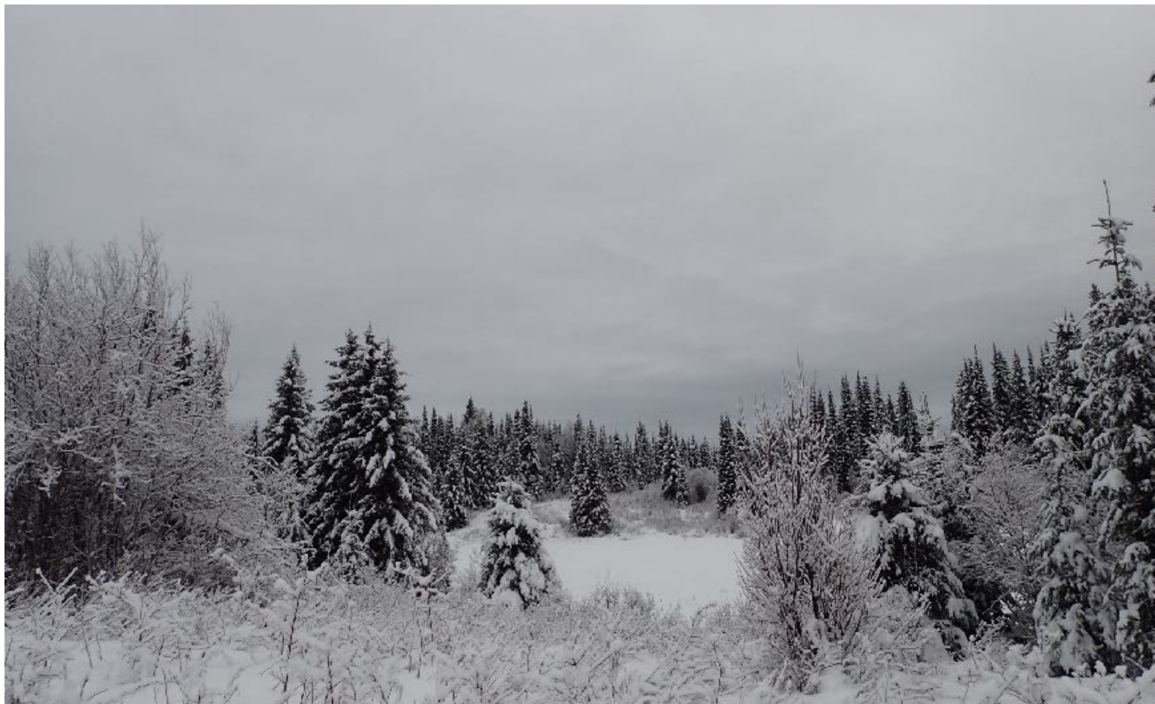
La vue des colons à côté du chalet, près d'un marais