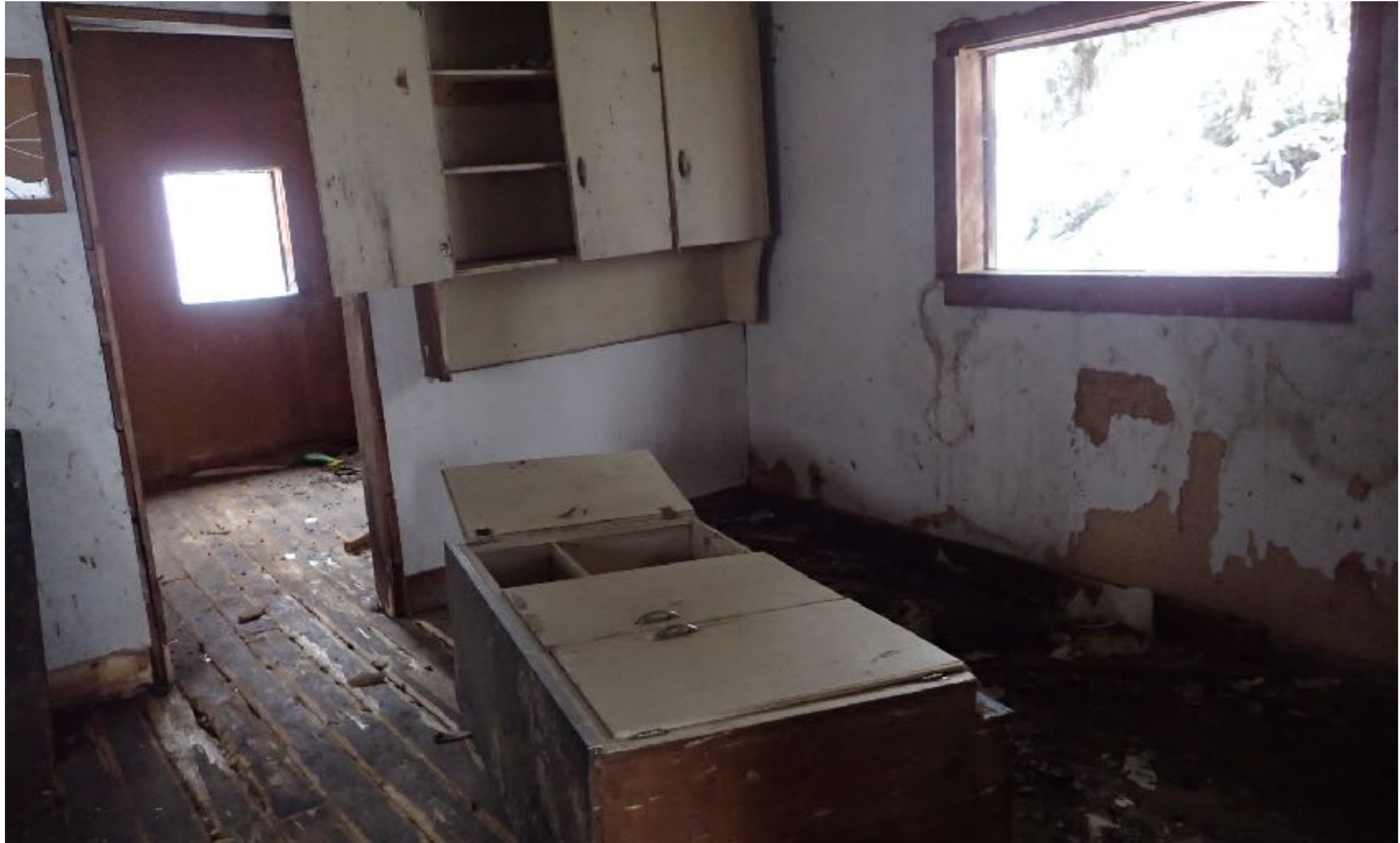
Le chalet le plus nouveau sur ma ferme